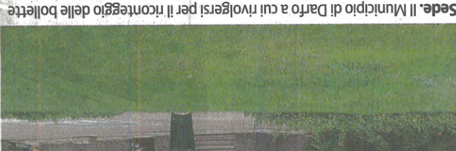
Sede. Il Municipio di Darfo a cui rivolgersi per il riconteggio delle bollette

identi in queste zone che hanno avuto aumenti spropositati possono contattare l'ufficio tributi per chiedere il riconteggio della tariffa». Quando? Dal lunedì al venerdì dalle 10 alle 12. Meglio su appuntamento allo 0364/541340. //